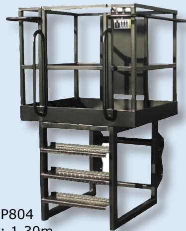
Abb. P804 Breite: 1,30m