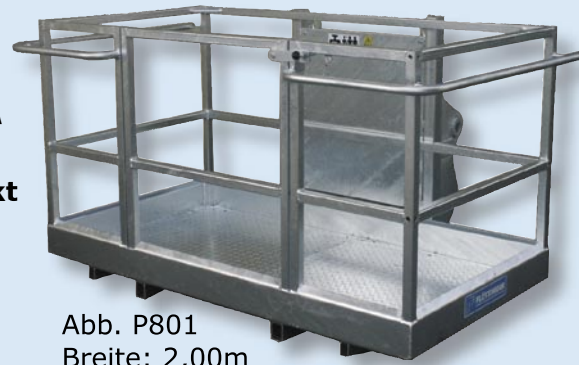
Abb. P801 Breite: 2,00m