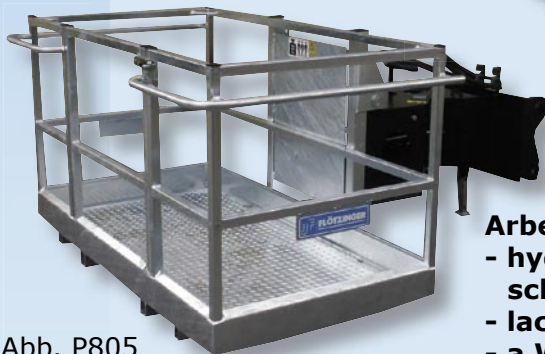
Abb. P805 Breite: 2,40m