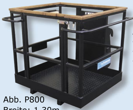
Abb. P800 Breite: 1,30m